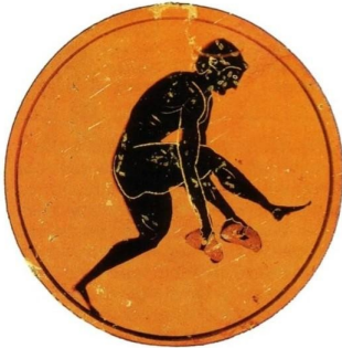
saut en longueur où l'athlète porte des poids

Les informations que nous avons sur les Jeux olympiques antiques ont été découvertes grâce aux fouilles des archéologues sur le site d'Olympie. Les objets ensevelis nous ont permis d'avoir une idée assez précise de l'organisation des Jeux olympiques de l'époque. De nombreux dessins ont été ainsi découverts sur des vases en terre. Ils représentent des scènes olympiques de l'époque.