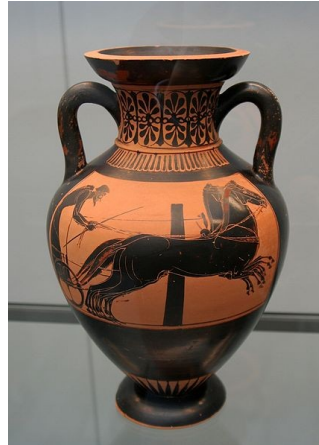
course de chars