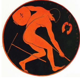
lancer de disque