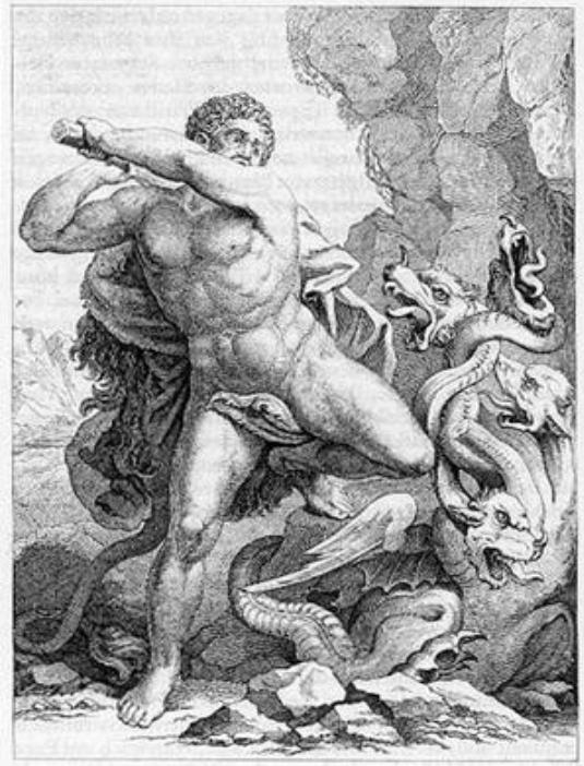
Héraclès tue l'Hydre

On dit que la longueur du stade fait 600 fois la taille du pied d'Héraclès.